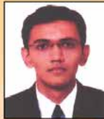
HARESHBHAI VARU MOCK TEST