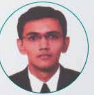
HAREESH VARU (TEST SERIES)