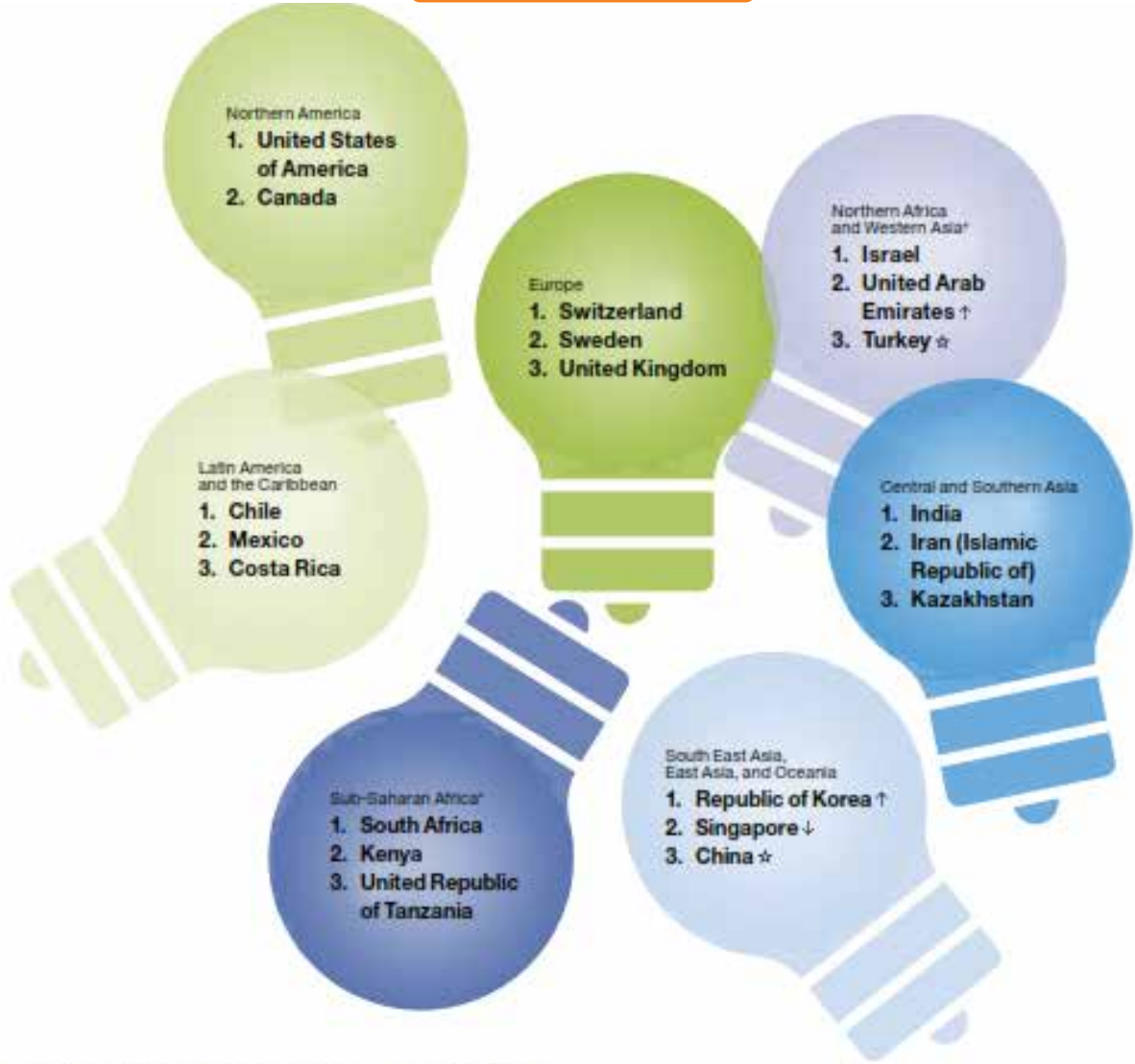
Top three innovation economies by income group