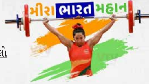
ટોક્યો ઓલિમ્પિક્સ 2020માં મીરાબાઈ ચાનુએ વેઈટલિફ્ટિંગમાં સિલ્વર મેડલ જીત્યો