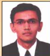
HARESHBHAI VARU MOCK TEST