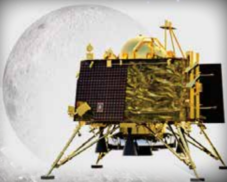
Lander - Vikram