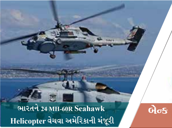
ભારતને 24 MH-60R Seahawk Helicopter વેચવા અમેરિકાની મંજૂરી