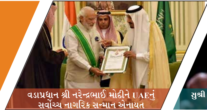
વડાપ્રધાન શ્રી નરેન્દ્રભાઈ મોદીને UAEનું સર્વોચ્ચ નાગરિક સન્માન એનાયત