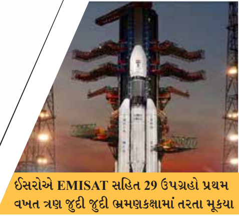
ઈસરોએ EMISAT સહિત 29 ઉપગ્રહો પ્રથમ વખત ત્રણ જુદી જુદી ભ્રમણકક્ષામાં તરતા મૂક્યા