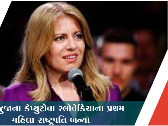
મુશ્રી જુબાના કેચુટોવા સ્લોવેકિયાના પ્રથમ મહિલા રાષ્ટ્રપતિ બન્યા