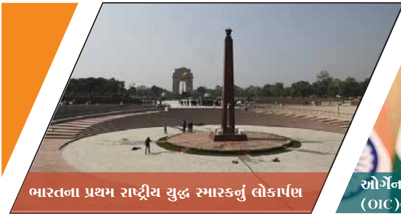
ભારતના પ્રથમ રાષ્ટ્રીય યુદ્ધ સ્મારકનું લોકાર્પણ