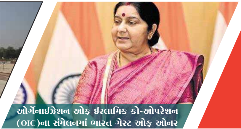
ઓર્ગેનાઇઝેશન ઓફ ઇસ્લામિક કો-ઓપરેશન (OIC)ના સંમેલનમાં ભારત ગેસ્ટ ઓફ ઓનર