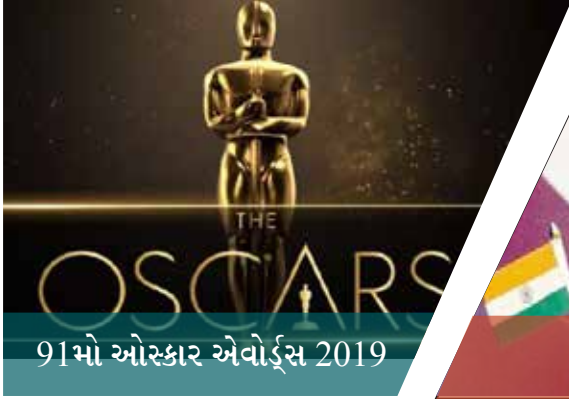
91મો ઓસ્કાર એવોર્ડ્સ 2019