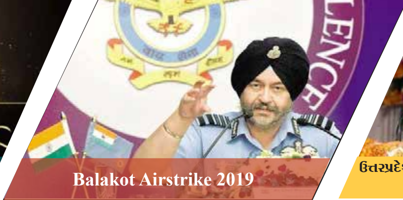
Balakot Airstrike 2019