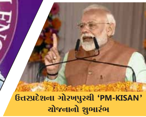
ઉત્તરપ્રદેશના ગોરખપુરથી 'PM-KISAN' યોજનાનો શુભારંભ