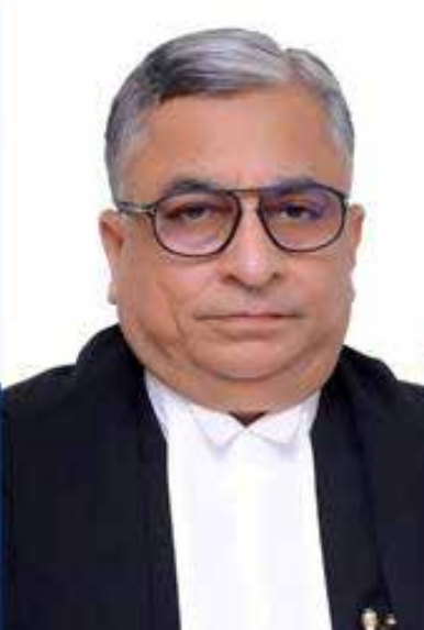
શ્રી કૃષ્ણ મુરારી